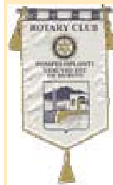
Il gagliardetto del Rotary Club Pompei Oplonti Vesuvio Est